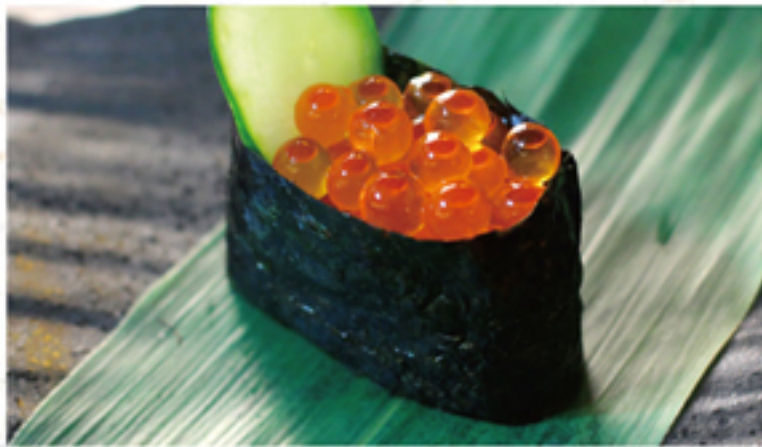
いくら 280円 一貫 (308円)