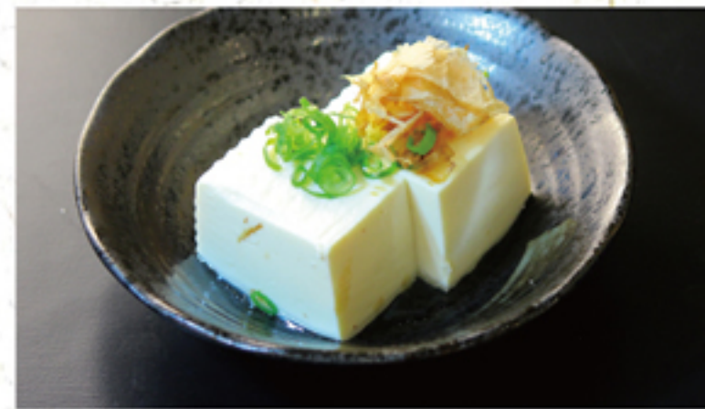
冷奴 200円 (220円)