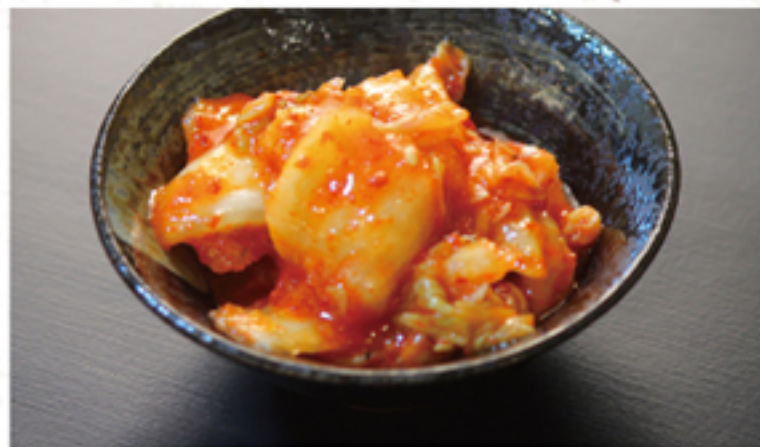
キムチ 300円 (330円)