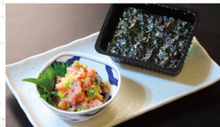
マグたく ~韓国海苔に包んで~ 580円 (638円)