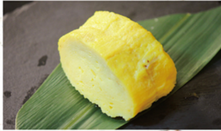
たまご焼き 180円 一貫 (198円)