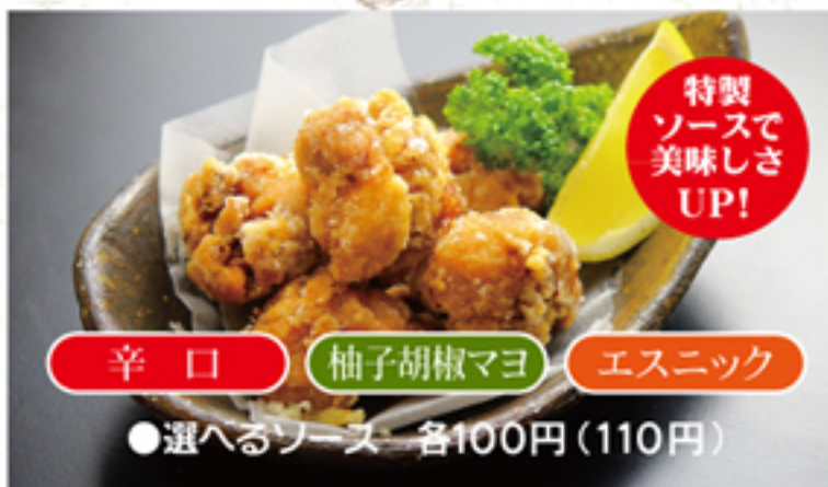
特製 ソースで 美味しさ UP! 辛口 柚子胡椒マヨ エスニック ●選べるソース 各100円(110円)