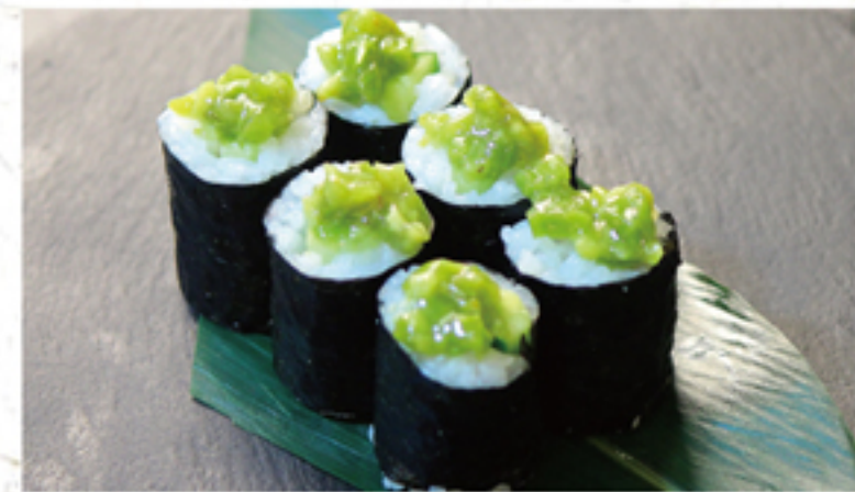
わさび巻き 300円 (330円)