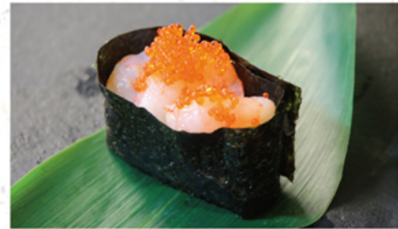
甘えび(軍艦) 220円 一貫 (242円)