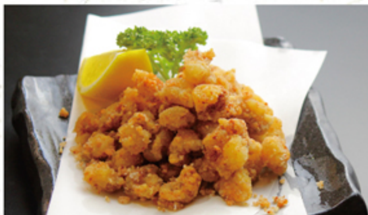
軟骨唐揚げ 380円 (418円)