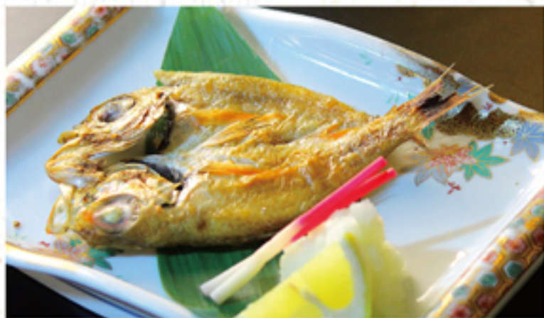
干物 のど黒 880円 (968円)