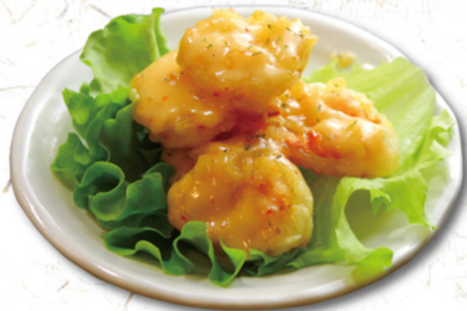
海老マヨ 580円 (630円)