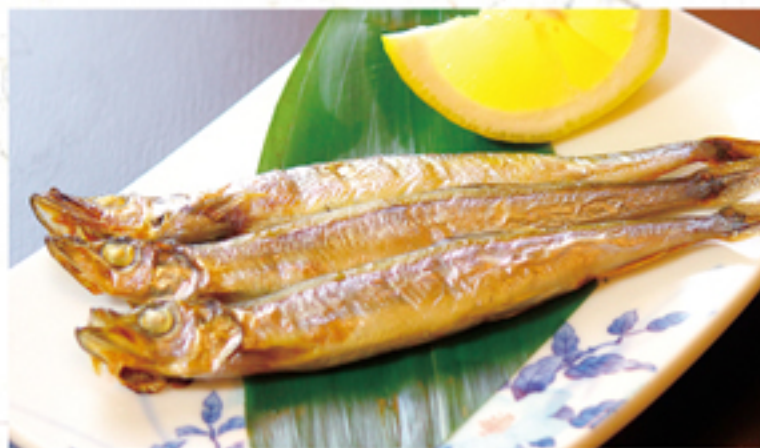
干物 子持ちししゃも 500円 ※3匹 (550円)