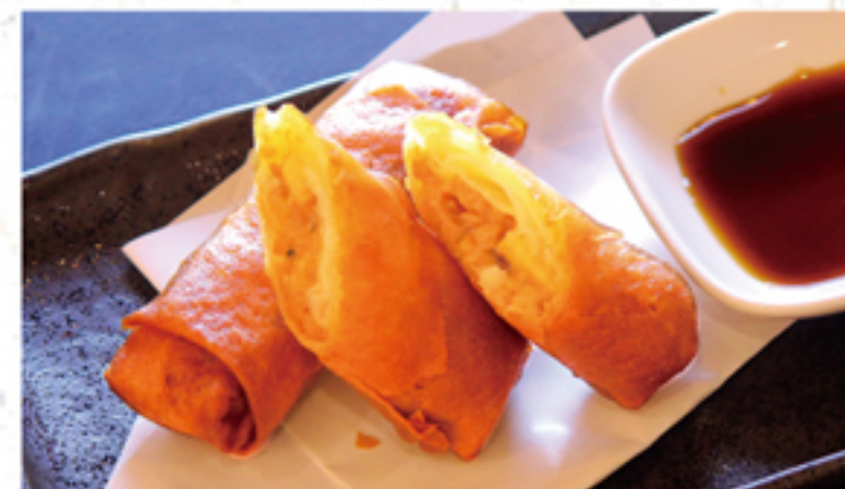
春巻き 320円 (2本) (352円)