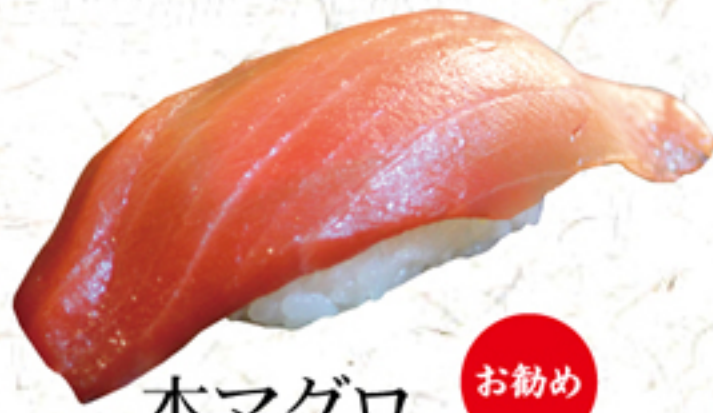
本マグロ お勧め 一貫 480円 (528円)