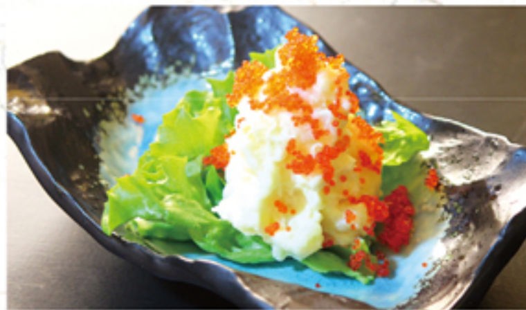
オリジナルポテサラ 380円 (418円)