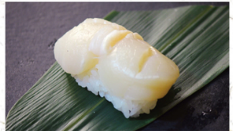
ホタテ貝柱 380円 一貫 (418円)