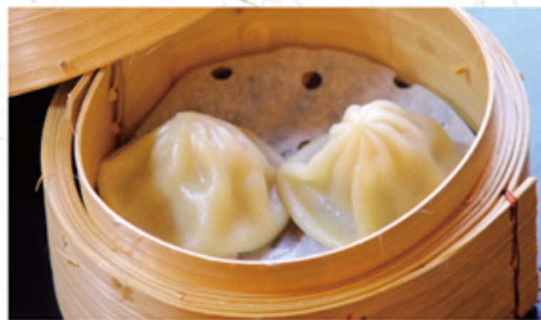
小籠包 240円 (2ヶ) (264円)