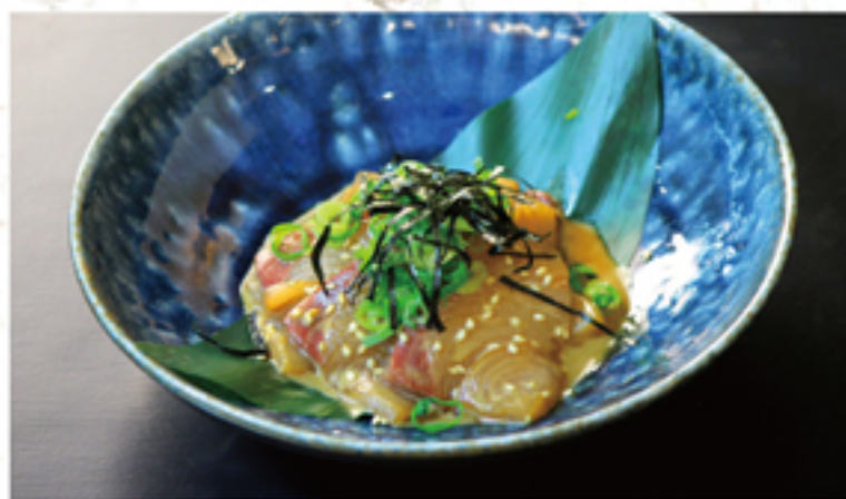
ごまぶり 780円 (858円)