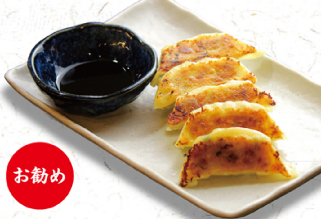
焼き餃子 350円 (630円)