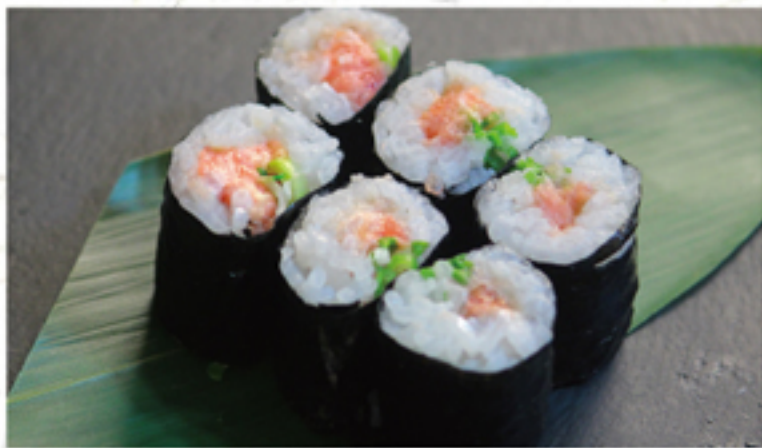
ネギトロ巻き 400円 (440円)