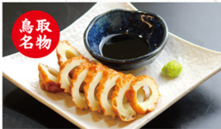
あごちくわ 450円 (495円)