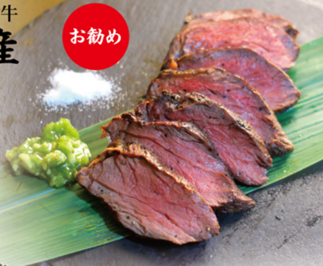
「国産」 ハラミ牛ステーキ 1,380円 (1,518円)