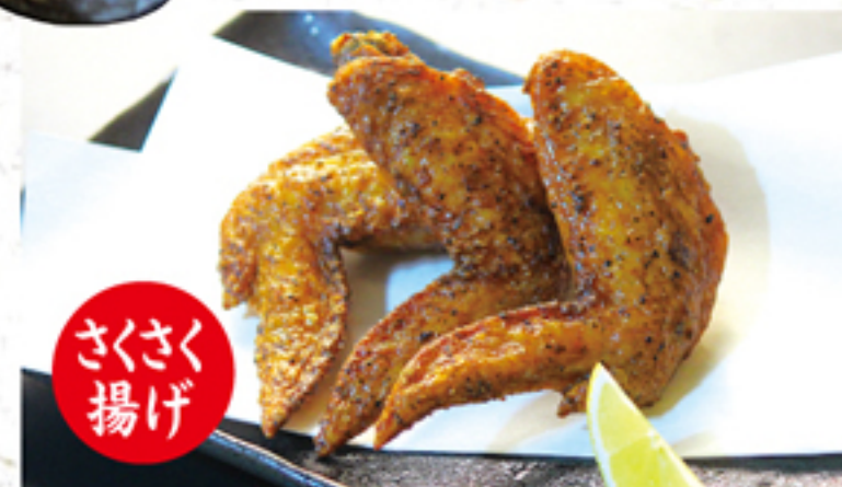
鶏の唐揚げ 580円 (638円)