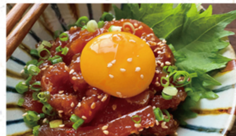
海鮮ユッケ 680円 (758円)