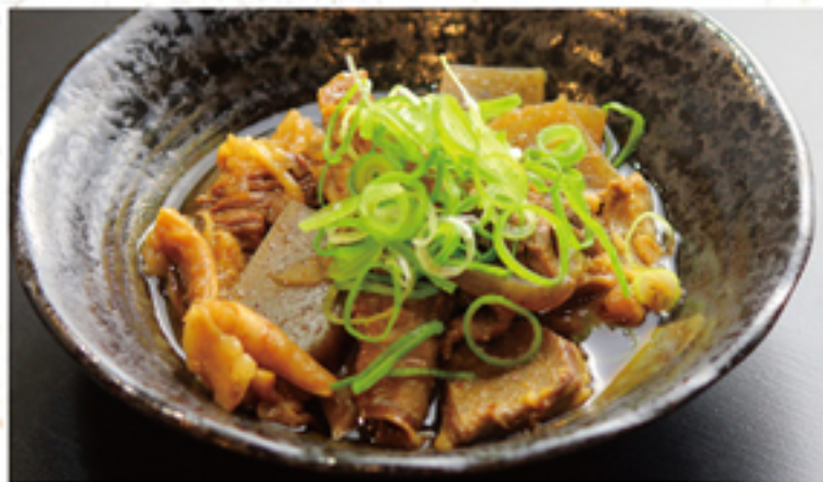
牛スジの土手煮 780円 (858円)