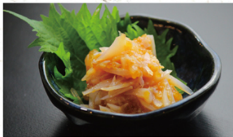
梅水晶 300円 (330円)