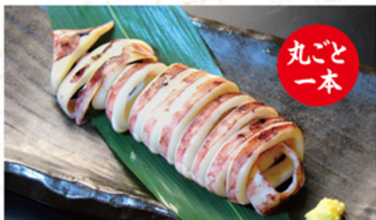
茹でイカ 600円 (660円)