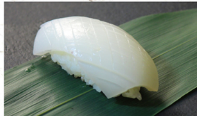
イカ 140円 一貫 (154円)