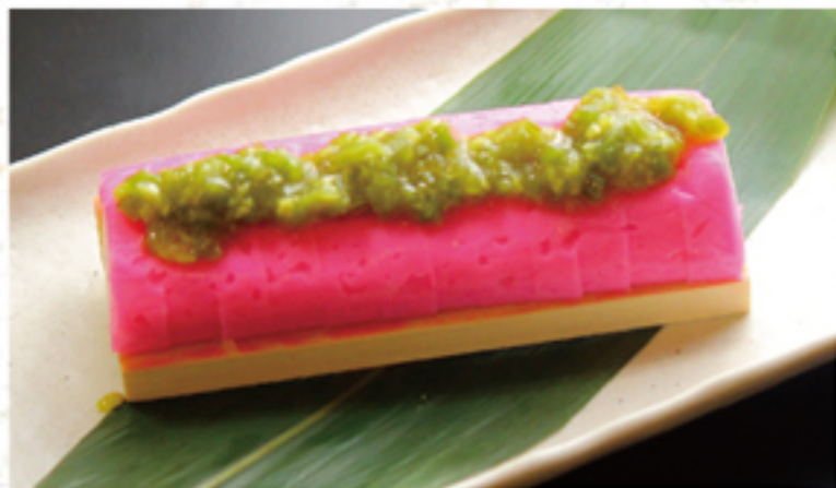
板わさ 380円 (418円)