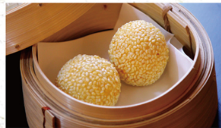
ゴマ団子 380円 (418円)