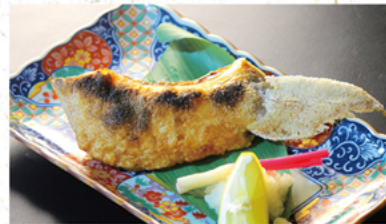
本日のカマ焼 580円 (638円)