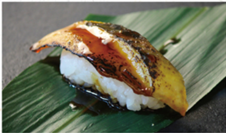
穴子 180円 一貫 (198円)