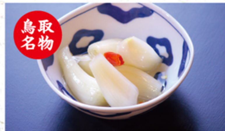
砂丘らっきょう 300円 (330円)