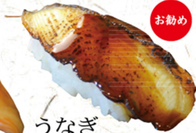
お勧め うなぎ 一貫 160円 (176円)