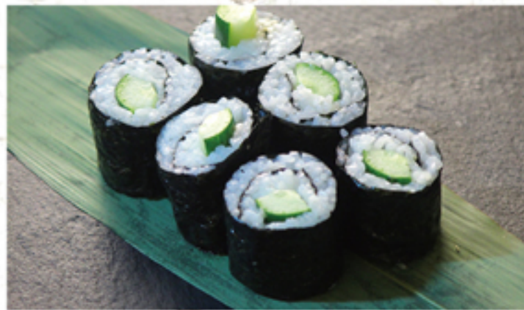
かっぱ巻き 220円 (242円)