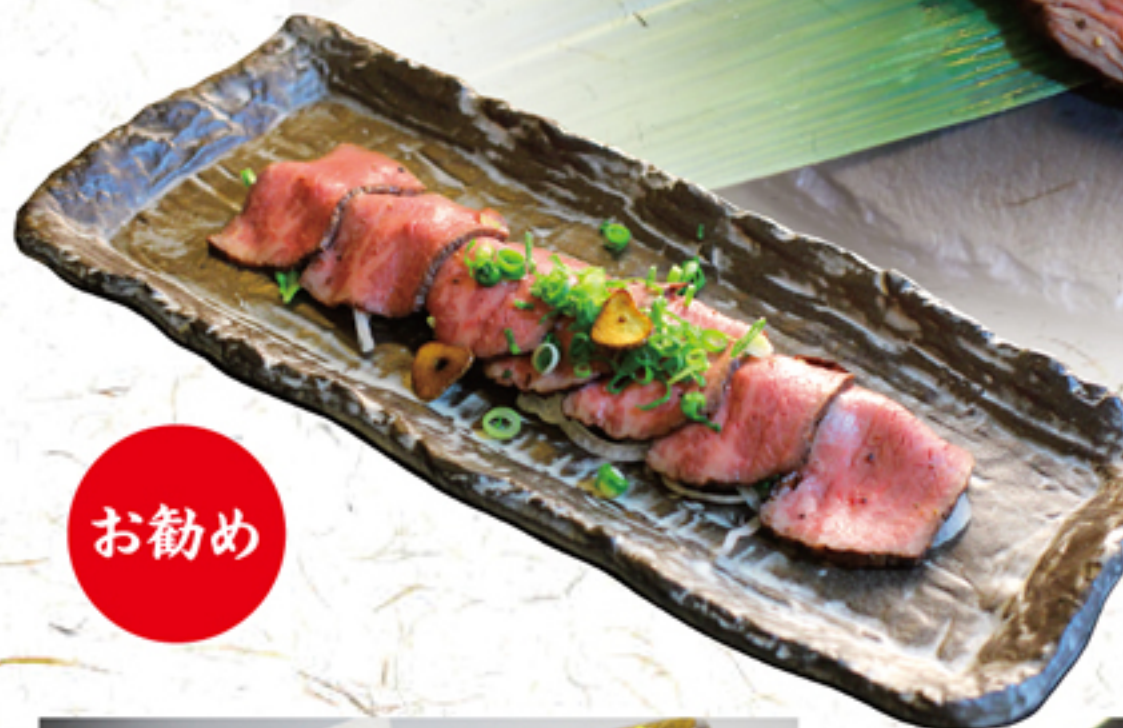
モリノスケ特性 ローストビーフ 1,200円 (1,320円)