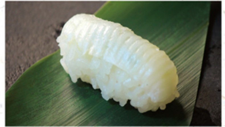
えんがわ 180円 一貫 (198円)