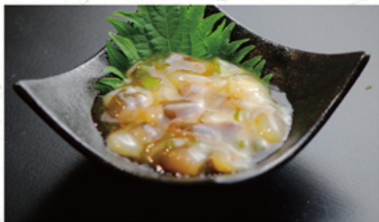
たこワサビ 300円 (330円)