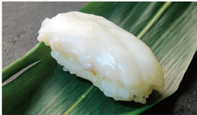
生タコ 120円 一貫 (132円)