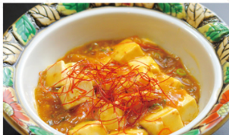
麻婆豆腐 580円 (638円)