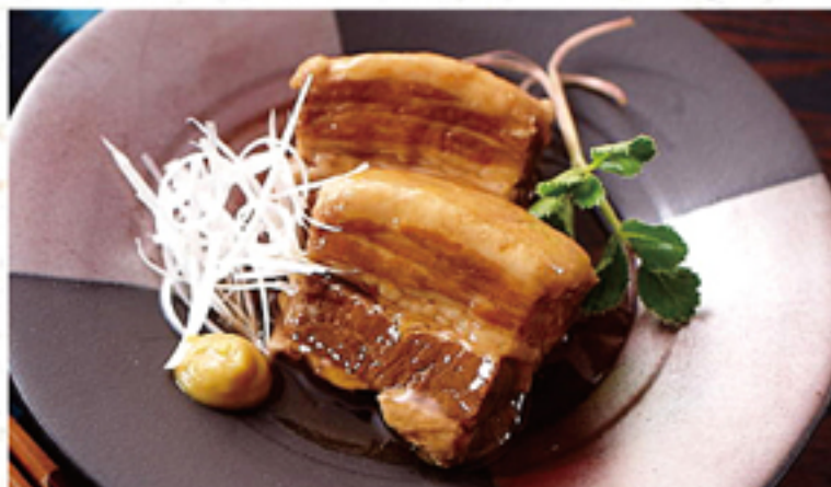
豚の角煮 780円 (858円)