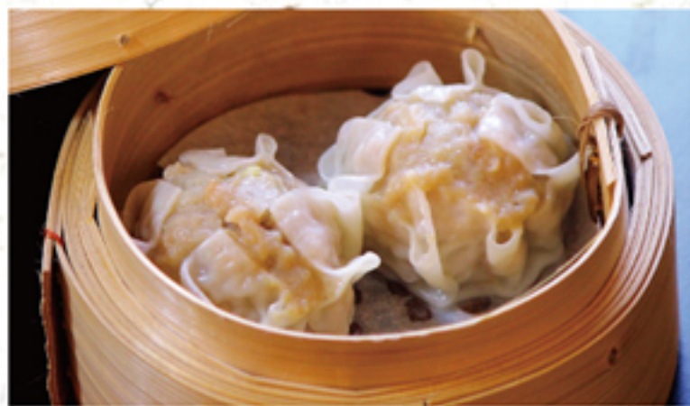
肉シュウマイ 200円 (2ヶ) (220円)