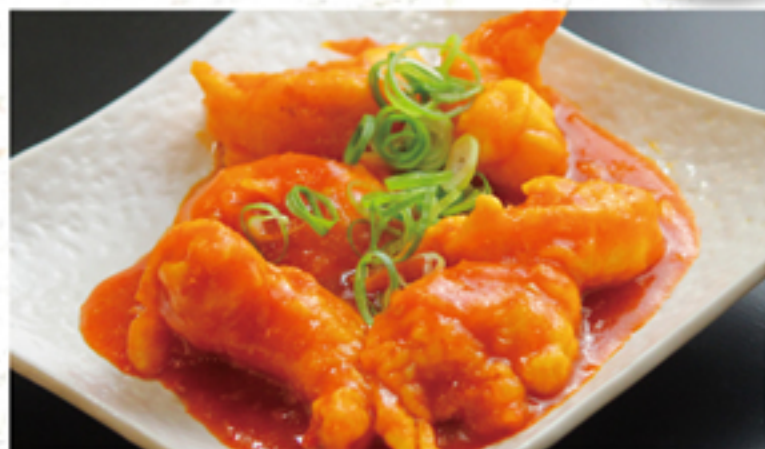
海老チリ 580円 (638円)