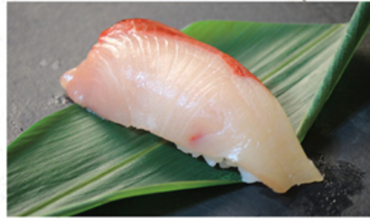
黒瀬ブリ 280円 一貫 (308円)