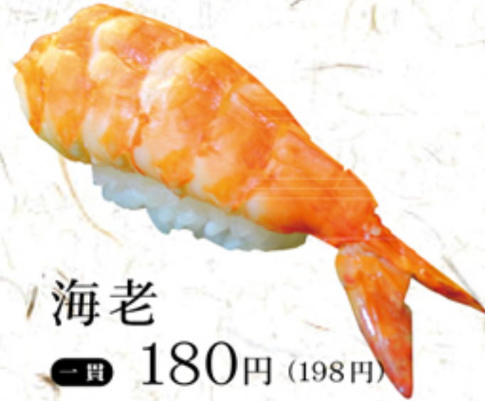
海老 一貫 180円 (198円)