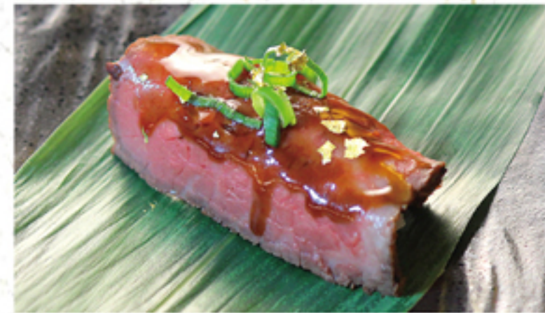
肉寿し 380円 一貫 (418円)