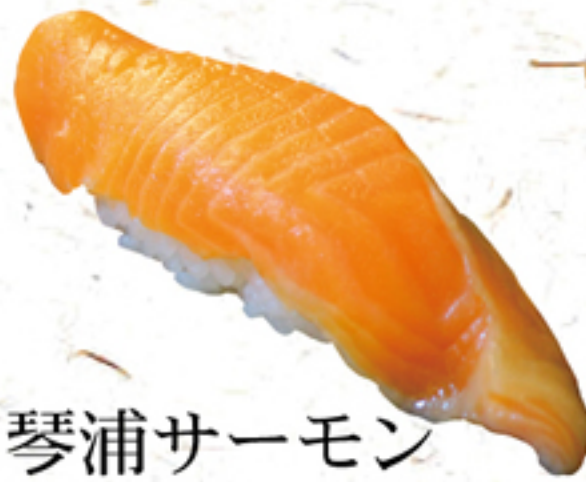
琴浦サーモン 一貫 220円 (242円)