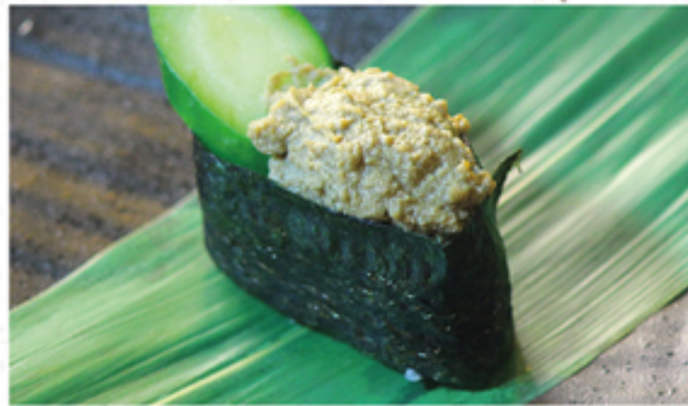
ズワイガニ味噌(軍艦) 220円 一貫 (242円)