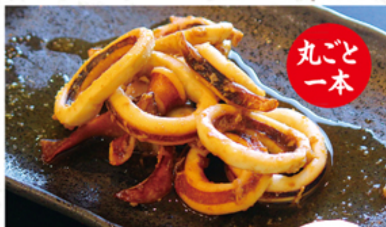
イカ焼き(屋台風) 600円 (660円)