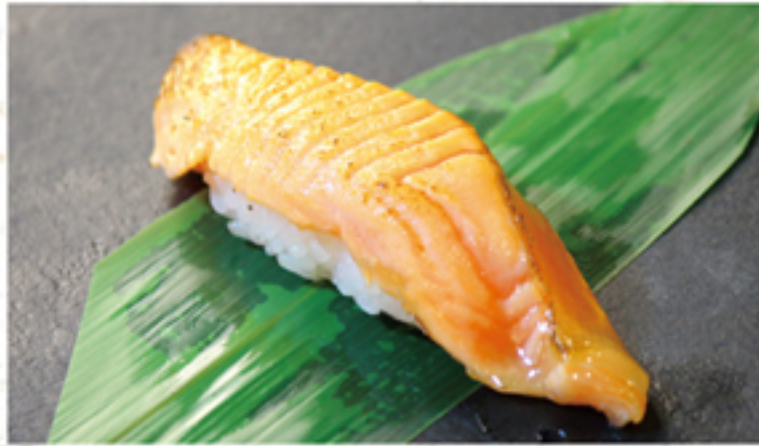
炙り琴浦サーモン 220円 一貫 (242円)