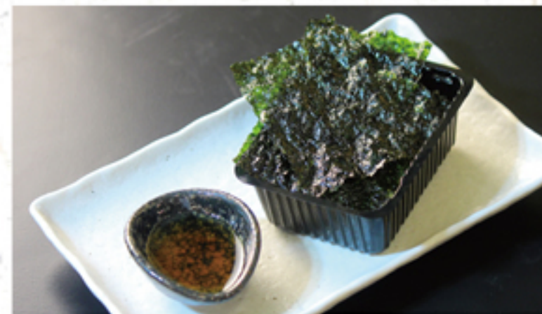
韓国海苔 200円 (220円)